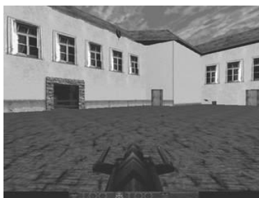
Obrázek 1: Obrázek.

No, a občas se může v textu samozřejmě také vyskytnout nějaký ten odkaz na obrázek. Obrázek 1 ukazuje něco, co jste ještě neviděli.